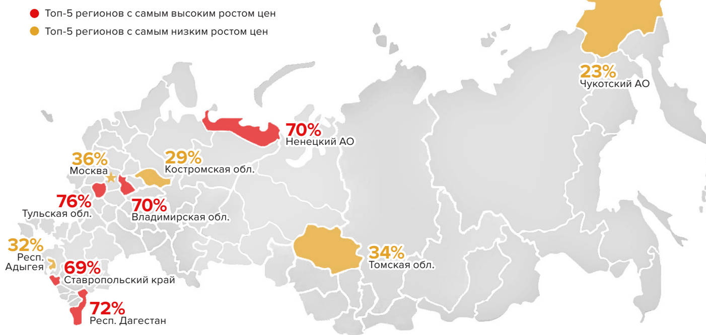
Рис.1 Рост цен на свинину по регионам за 5 лет