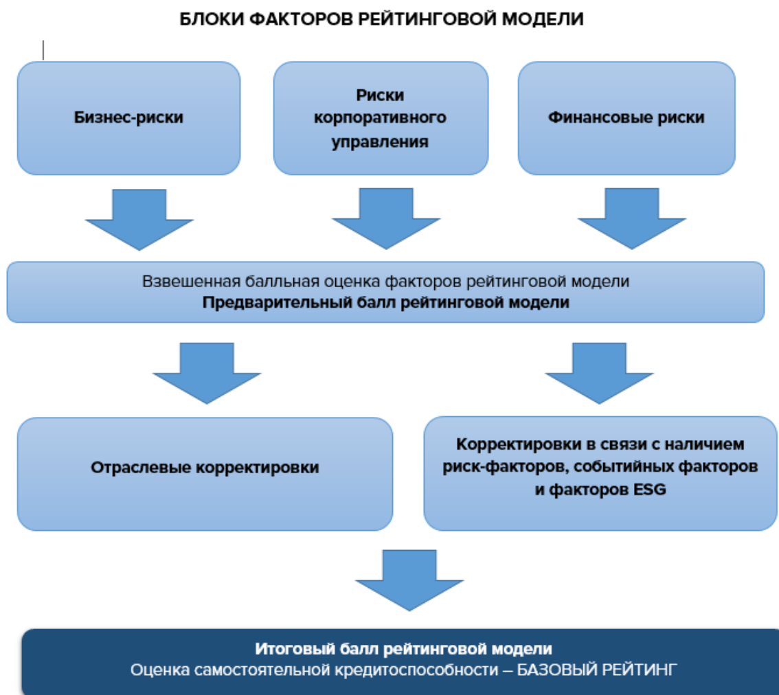
Схема 1. Структура рейтингового анализа для оценки самостоятельной кредитоспособности (Базовый рейтинг) нефинансовой компании